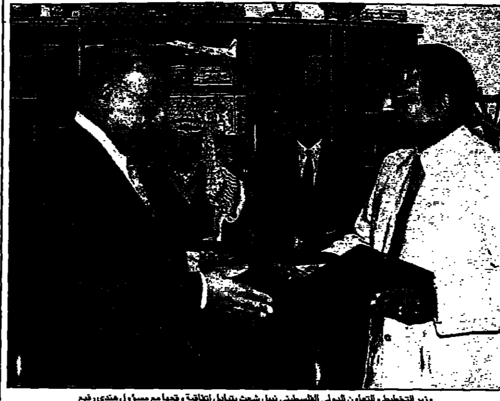
وزير التخطيط والتعاون الدولي الفلسطيني رئيس شعبة بحوث وإعداد التقارير في غزة أمس الأول (رويتز)

غزة - وزير شؤون رئاسة ياسر عرفات أمس الثلاثاء 16 يونيو، بدأ محادثات موسعة بشأن تشكيل حكومة جديدة بعد أن أنهى المجلس التشريعي الفلسطيني عشرة أيام لإجراء إصلاحات سياسية. وبعد عرفات إلى الاجتماعات فصلات سياسية فلسطينية مختلفة من بينها حركة المقاومة الإسلامية (حماس) التي تمثل المعارضة للخليفة الرئيسية للسلطة. لكن مسؤولاً بحماس قال إن مسؤولي السلطة الفلسطينية أبدوا الصراحة في المحادثات مع عرفات التي كان من المقرر أن تجري مساء أمس في أريحا. وقال مسؤول حماس في بيانها إن اجتماعات عرفات مع المجلس التشريعي لم يتعد موعداً آخر بعد، وسيكون ذلك في اتصالاً قادمين، ولم يوضح المسؤول كلاً ما تجلت المحادثات. وشرح مسؤول حماس رغبة مساعد عرفات لروبيرتو بان الرئيس الفلسطيني بدأ مشاورته بعد اجتماع مع أحمد قريع رئيس المجلس التشريعي ونائبه. ولم يسمح لوسائل الإعلام بحضور الاجتماعات. والرئيس اجتماع مع سرح للعلماء الفلسطينيين بشأن الطلبة التي في إطار المناقشات التي يجريها الرئيس عرفات لتشكيل حكومة فلسطينية جديدة تشمل جميع الإصلاحات التي يطالب في مؤسسات السلطة الفلسطينية. وذكر مسؤول حماس رغبة مساعد عرفات لروبيرتو بان الرئيس الفلسطيني بدأ مشاورته بعد اجتماع مع أحمد قريع رئيس المجلس التشريعي ونائبه. ولم يسمح لوسائل الإعلام بحضور الاجتماعات. والرئيس اجتماع مع سرح للعلماء الفلسطينيين بشأن الطلبة التي في إطار المناقشات التي يجريها الرئيس عرفات لتشكيل حكومة فلسطينية جديدة تشمل جميع الإصلاحات التي يطالب في مؤسسات السلطة الفلسطينية.